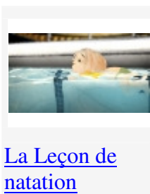
La Leçon de natation